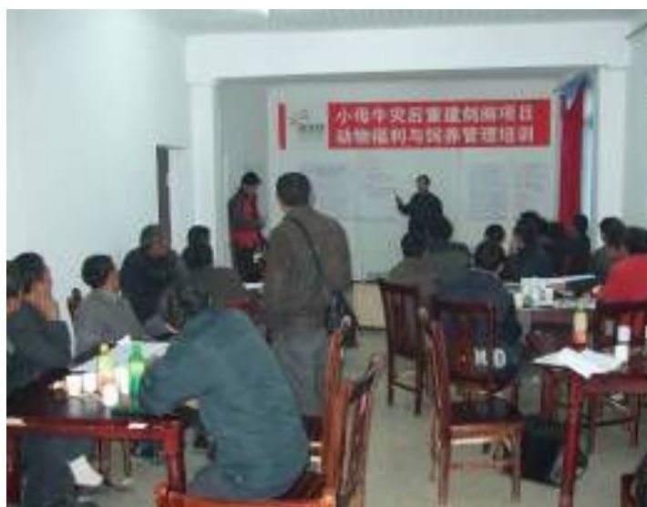
劍閣縣白龍鎮石灘村項目農戶參加培訓