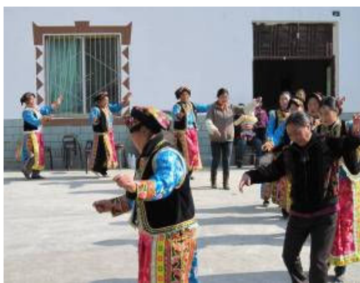
卡子村婦女互助組在參加社區活動