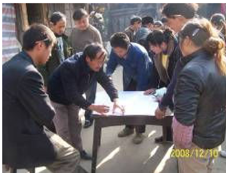
位於極重災區的江油市與青川縣交界的雁門鎮深山區柳壩村村民共同參與規劃未來