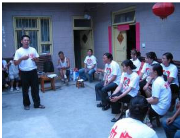
理縣卡子村婦女互助組在參加培訓